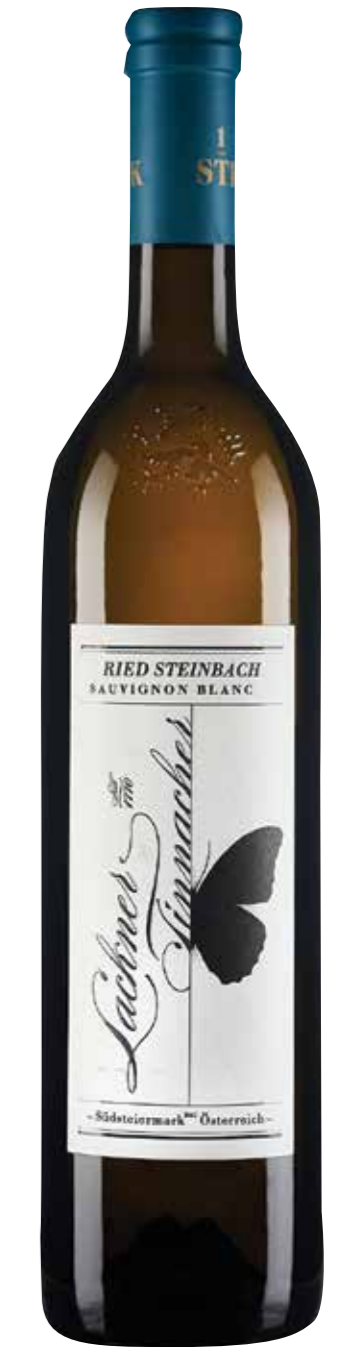
und Karamell, gelbe Tropenfrucht, würziges Bukett, facettenreiche Aromatik. Saftig und elegant, feine Extraktsüße, mineralisch-salzig, feiner Säurebogen, etwas Blütenhonig im Nachhall zeigt Länge und Zukunft. weinhof-pfeiffer.at, € 29,50